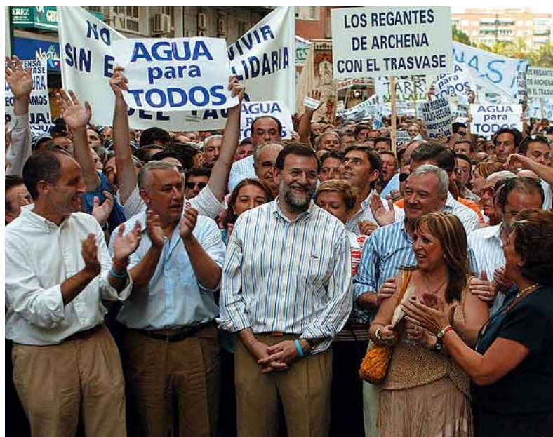
Rajoy, con los dirigentes del PP de Valencia, Andalucía y Murcia, manifestándose en contra de la caducidad del trasvase y contra Castilla-La Mancha

No es probable que los castellano-manchegos olviden fácilmente las injurias que De Cospedal les ha infligido: su posicionamiento constante con Murcia, Valencia y la derecha andaluza contra Castilla-La Mancha, en los temas del agua. Su intento de evitar la modernización de nuestra región en beneficio de Madrid. Su campaña para hundir a Caja Castilla-La Mancha. Cuando dentro de poco se marche, y no dudamos que lo hará, re-